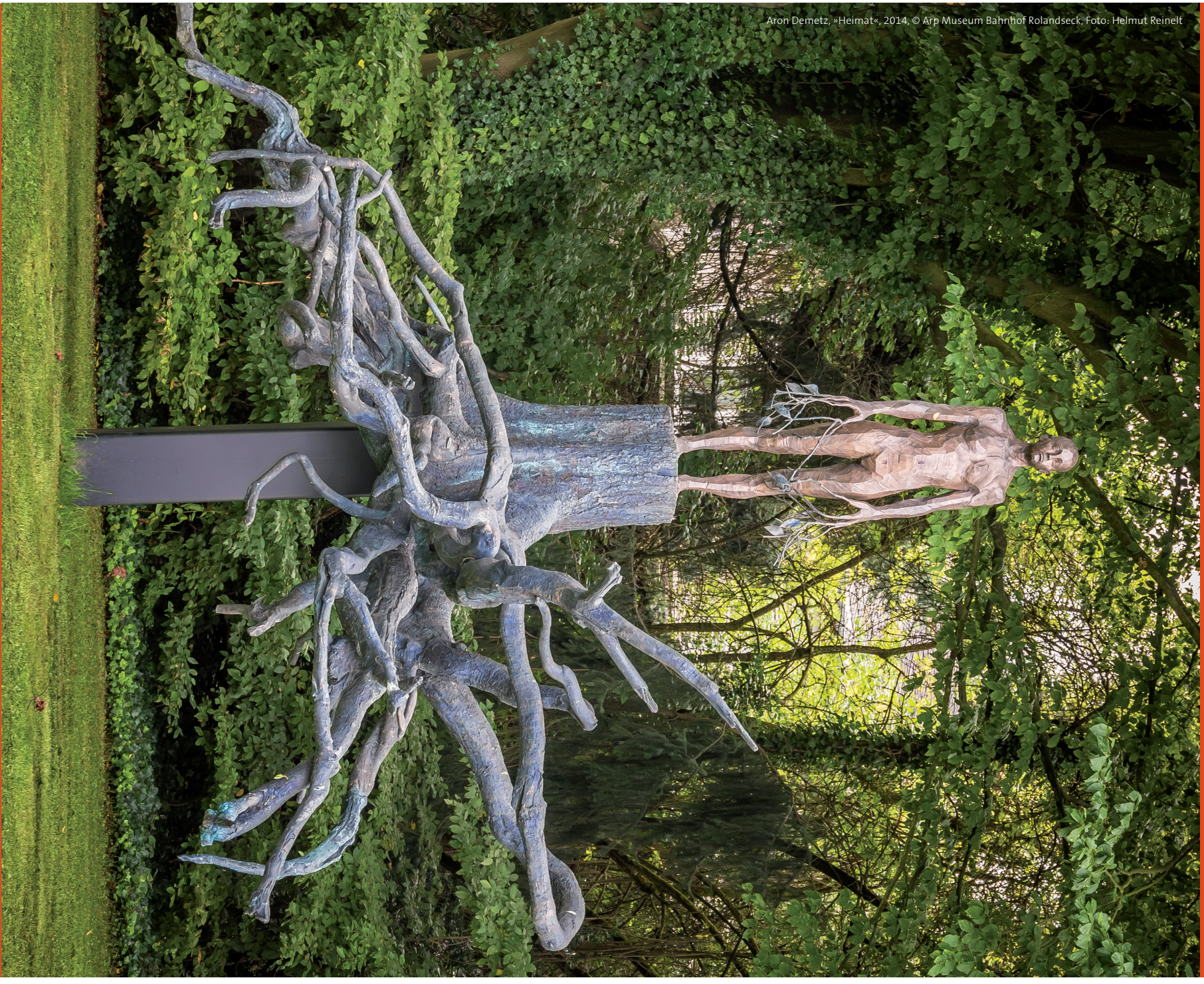
Aron Demetz, »Heimat«, 2014, © Arp Museum Bahnhof Rolandseck, Foto: Helmut Reinelt

30.08. – 02.12.2018 STADTGALERIE NEUWIED