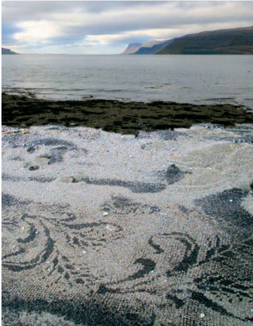
... reisen durch eine nachtlose Welt