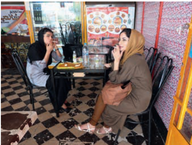
Projekt 2012: Picknick in Persien. Autobahnraststätte Foto auf Kunststoff, 60 x 80 cm