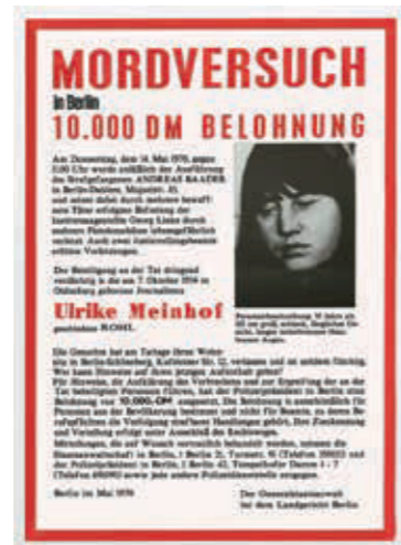
Aus der Serie: WANTED 2016/2017. Ulrike Meinhof. NSU-Terror Stickerei und Foto auf Stoff, je 90 x 120 cm

BEATE PASSOW has been doing this all her life. It is not by chance that her year of birth 1945 is influencing her artistic socialization. She started her studies with painting, but very early turned to photography, following her dedicated observations. A medium which adequately transports her political view on social phenomena. For this she is not using only one visual program.